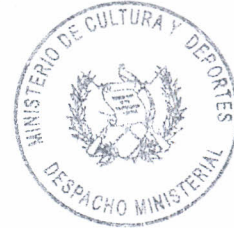
Dwight Anthony Pezzarossi Garcia Ministro de Cultura y Deportes